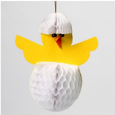
Een andere variant