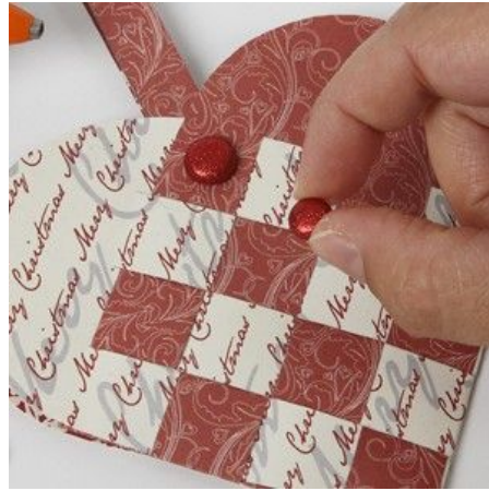
8 Glue the brad onto the heart using a glue gun.