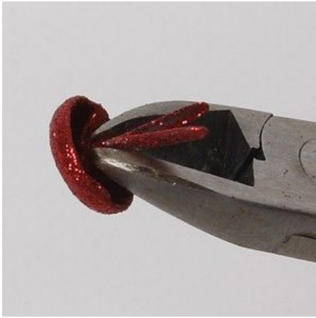
7 Cut off the legs of a brad.