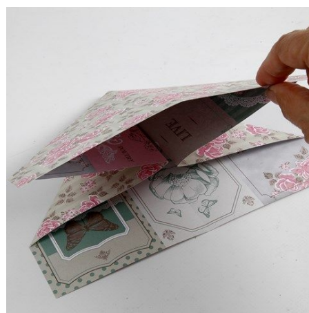
9. Het papier heeft nu 8 vouwlijnen die u kunt gebruiken om de tas te vouwen. Vouw het papier naar binnen richting de diagonale vouwlijnen. U heeft nu een driehoekige hoed vorm die open is aan de onderkant.