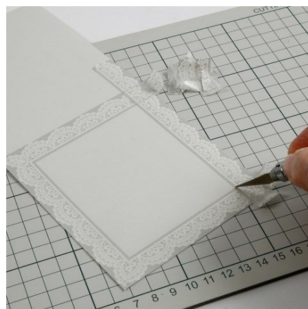
6. Maak in elke hoek waar de masking tape elkaar overlapt een diagonale snede en verwijder het teveel aan tape. Decoreer de menukaart volgens dezelfde procedure als de uitnodiging.