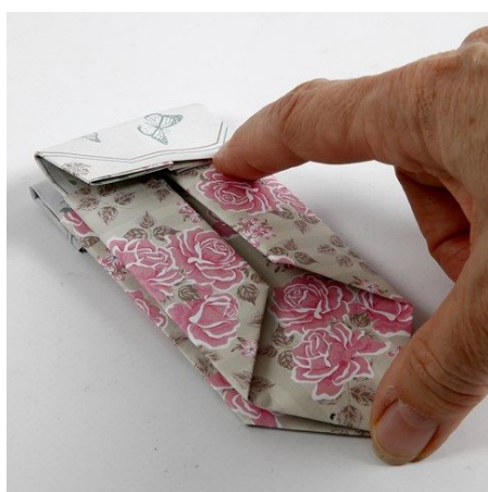
11. Vouw het papier van de bovenkant naar beneden tot de rand van het patroon aan de achterzijde. Herhaal dit aan de andere kant en duw de bodem van de binnenkant plat. Doe een kleine verrassing in het tasje en sluit deze met een mini wasknijper.