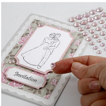
4. Decoreer met zelfklevende strasstenen.