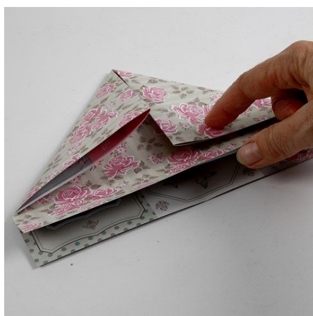
8. Vouw een cadeautasje/doozje van design papier. Vouw het papier diagonaal en horizontaal in het midden. Vouw uit. Vouw elk van de vier hoeken naar de rillijn in het midden. Vouw uit.