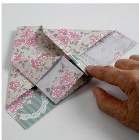
10. Vouw elke kant van de top laag naar het midden, doe dit twee keer. Herhaal aan de andere kant.