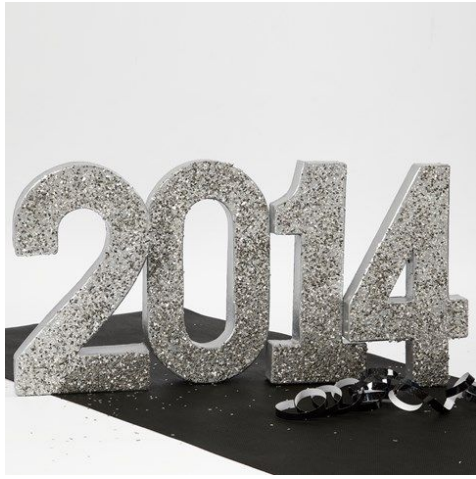
Nog een voorbeeld