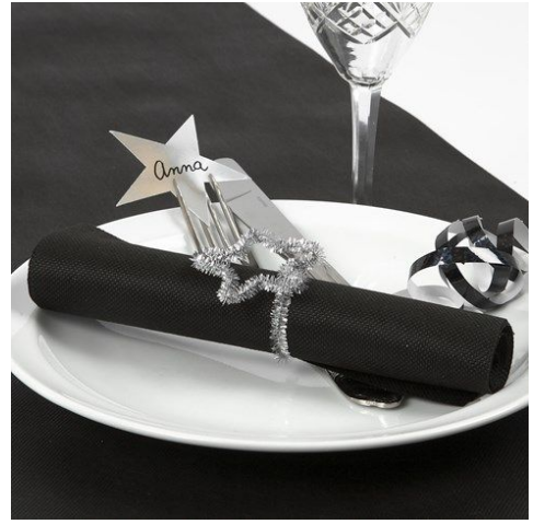
En nog één