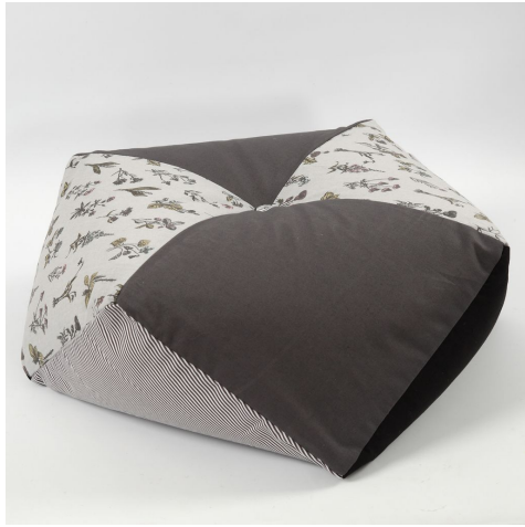
Een andere variant