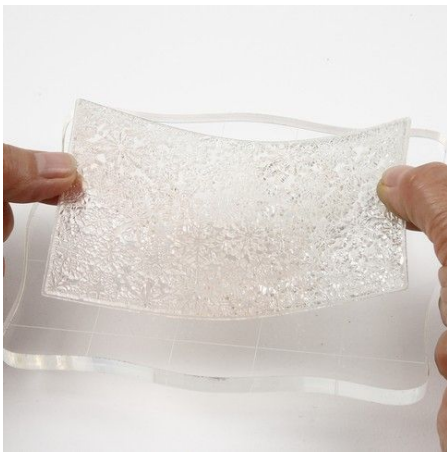
1. Plaats de silicone stempel op het acrylblok.