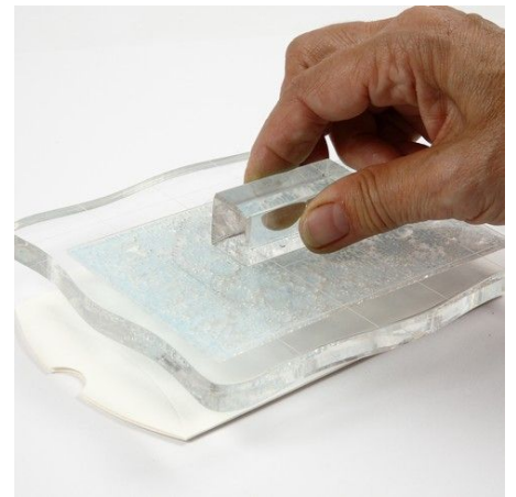
3. Bestempel een doosje. Laat het drogen.