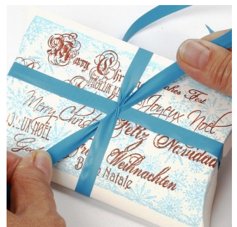
6. Bind een lint rond de doos.