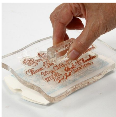
5. Stempel hiermee bovenop de eerste afdruk.