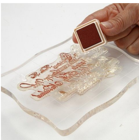
4. Breng nu een andere kleur verf aan op een andere stempel.