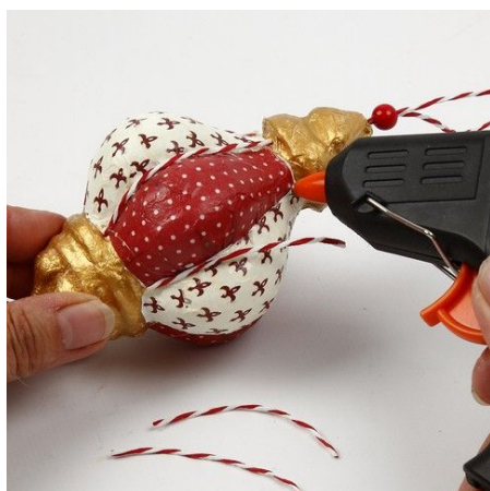
8. Lijm papiergaren op de vouwlijnen van de vlakken zoals afgebeeld. Gebruik ook papiergaren om een ophanglus te maken. Rijg een rode houten kraal aan de ophanglus.