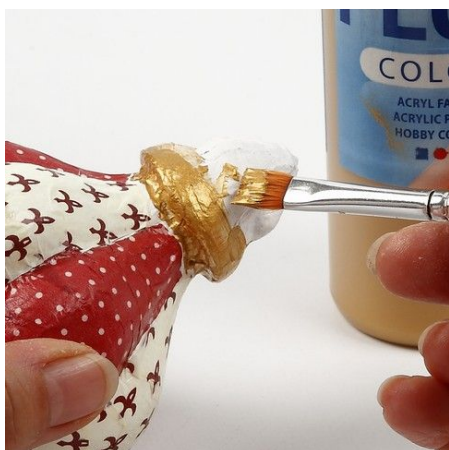
7. Beschilder de boven- en onderkant met goudverf.