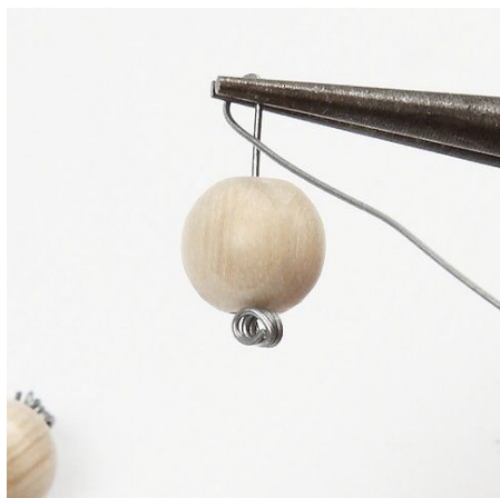
8. Maak kerstversiering voor de boom met een tangetje.