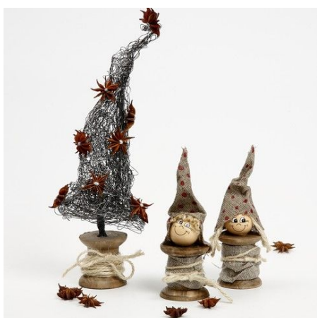
10 En nog een variant