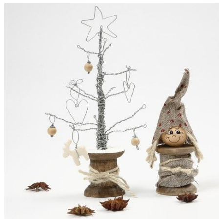
9 Een andere variant