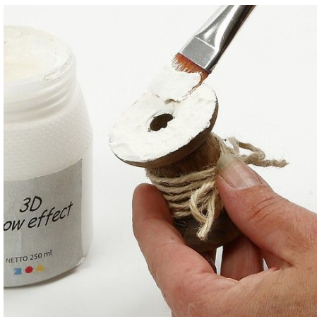
7. Verf de houten spoel met 3D sneeuw pasta.