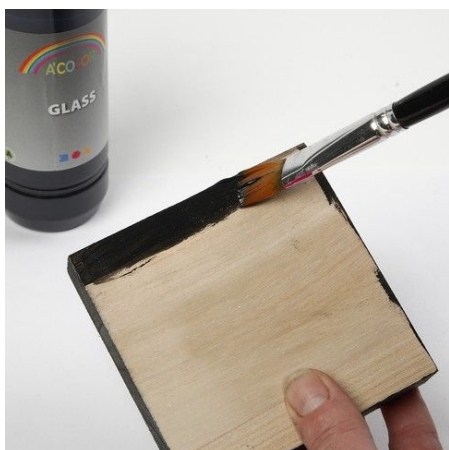
5. Verf de houten icoon met zwarte verf.