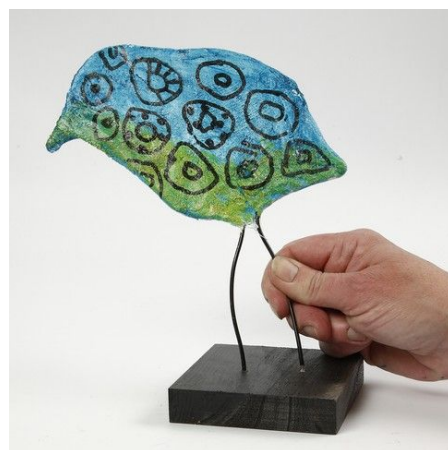
7. Duw de poten van het kuiken in de voorgeboorde gaten. Gebruik eventueel een beetje lijm om het kuiken goed vast te zetten.