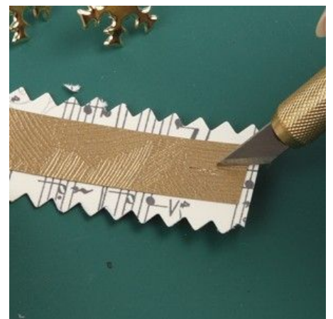
6 Make a hole in each end of the strip.