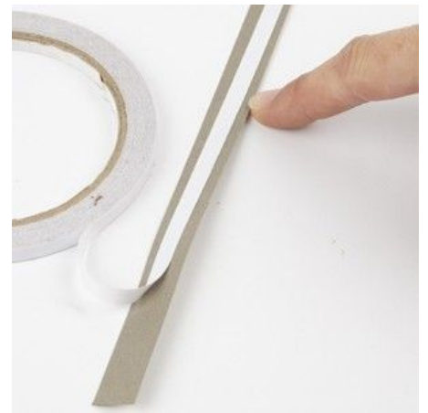
3 Attach double-sided adhesive tape on the back of a Weaving Paper Strip.