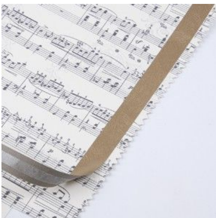
4 Fasten the strip on a piece of Music Notes Card.