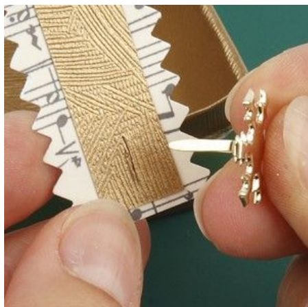
8 Fasten the handle with a brad.