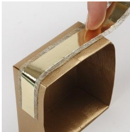
2 Attach it to the box with double-sided adhesive tape.