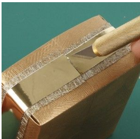
7 Make a hole on two of the box's sides.