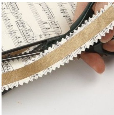
5 Cut out with Kidzors Paper Edge Scissors.