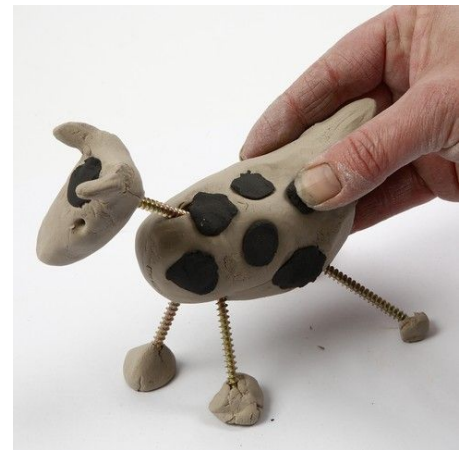
3. Dots, stripes etc. may either be painted or modelled onto the animal by using a small amount of water. Let it dry.