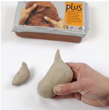
1. Model an animal body from self-hardening clay.