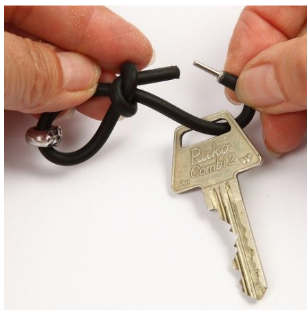
5. Open the lock and put the key onto the keyring.