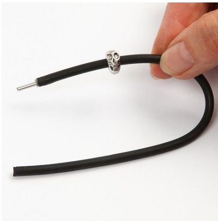
1. Thread a bead onto the silicone bracelet.