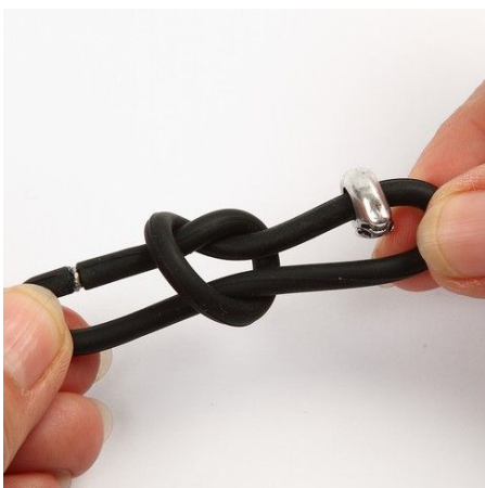
4. Tighten the knot.