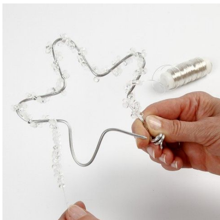
7. Wrap a piece of silver-plated wire with drop-shaped glass bead around the star.