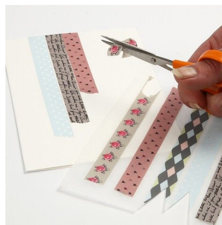
3. Masking tape attached onto a piece of baking paper may be cut out in small designs, f.ex. individual roses.