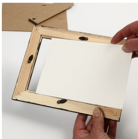
4. Fit the picture in the frame.