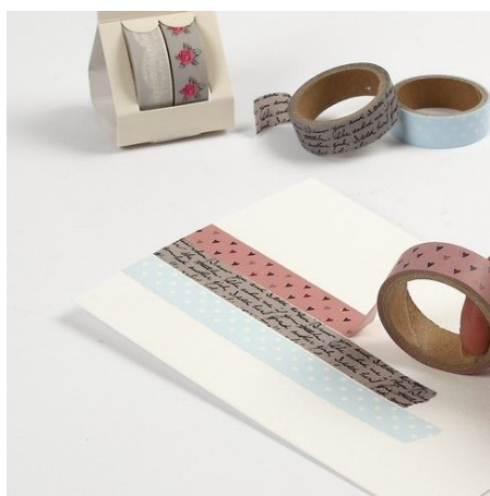
2. Attach pieces of masking tape in a pattern onto a piece of card.