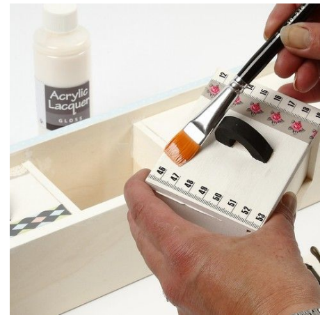
3. Dek de kapstok als laatst af met twee lagen vernis.