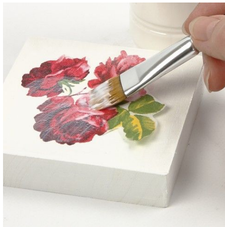
2. Knip het figuurtje uit het servet en bevestig op het ikoon met decoupagelak.