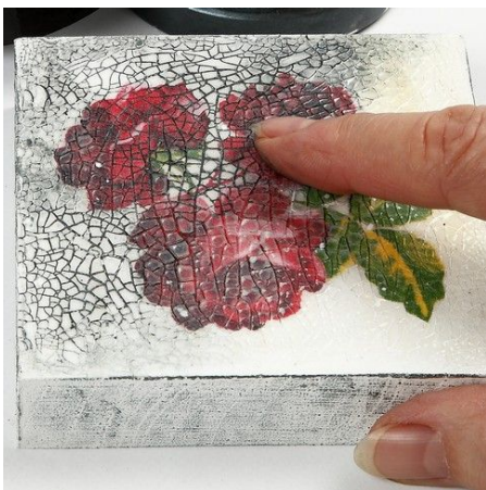
4. Wrijf Inka Gold creamy metal gloss was in de crackling groeven met een ronddraaiende beweging.