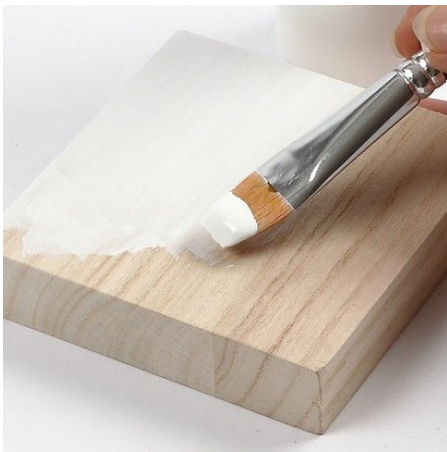
1. Beschilder het ikoon met witte Plus Color verf.