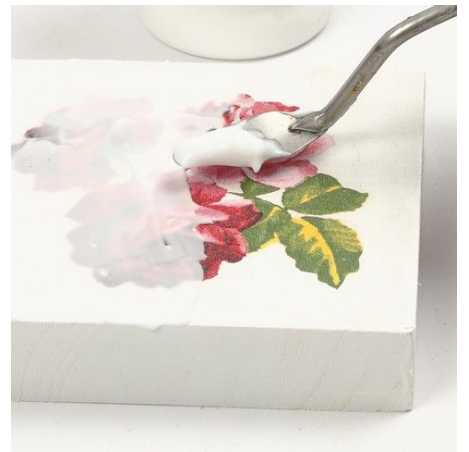
3. Breng een ruime 2-4mm laag van de crackle lak transparante Facetten-Lack aan, met behulp van een spatel. Het crackling proces begint na een paar uur.