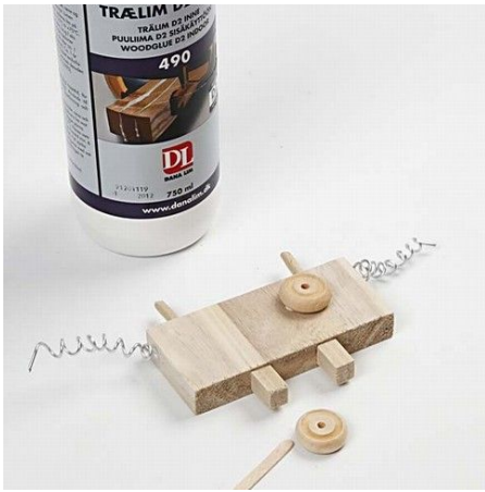
7. Glue on the other parts.