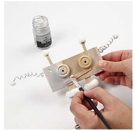
9. Paint the robot with Art Metal silver paint.