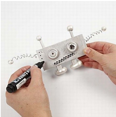
10. Decorate the robot with a black power liner permanent marker.