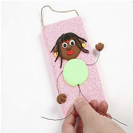
10. Attach the floral wire underneath the body.