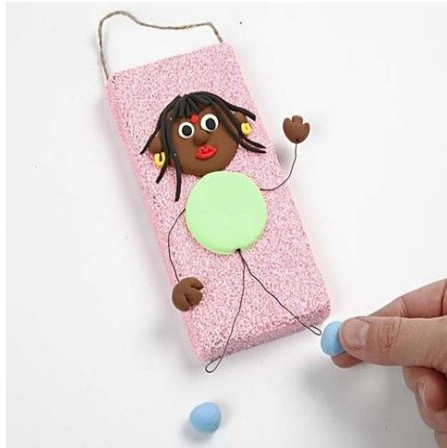
11. Roll two balls for feet and attach to the legs.