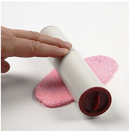
1. Roll out the Foam Clay into a thin sheet.