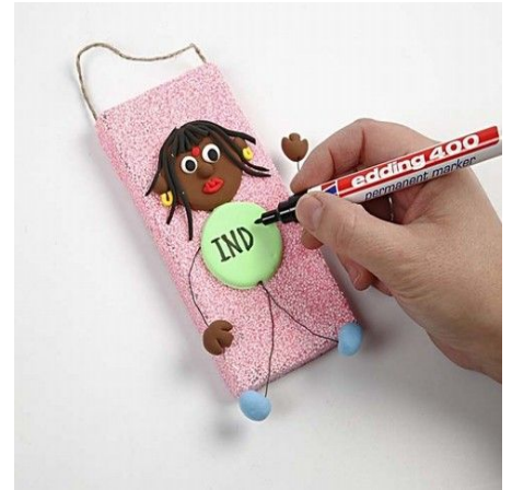
12. Write text on the tummy using a black Edding Marker Pen.