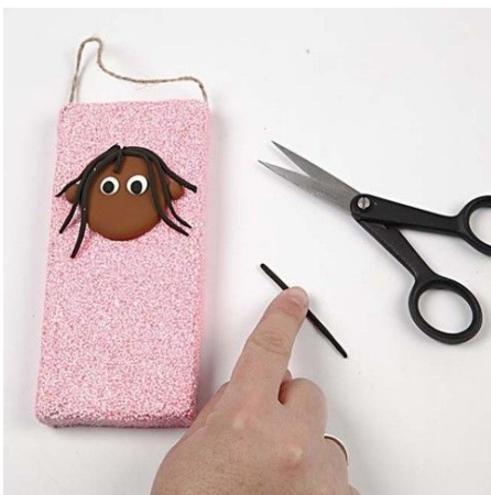
4. Roll out Silk Clay for hair and attach.