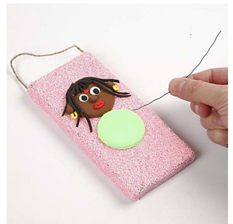
6. Attach the floral wire underneath the body.