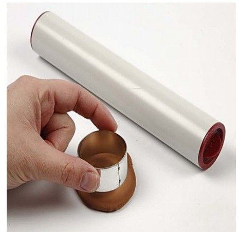
3. Roll out Silk Clay and use a shape cutter to cut out the head. Attach the head onto the icon and use Silk Clay for making the face.