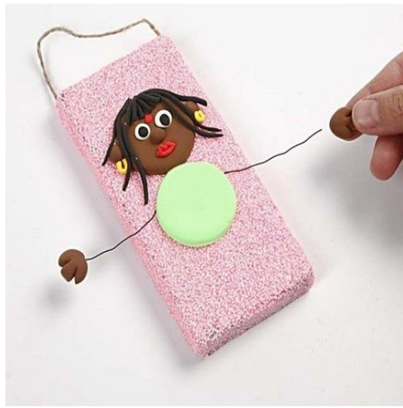
8. Attach the hands onto the floral wire.