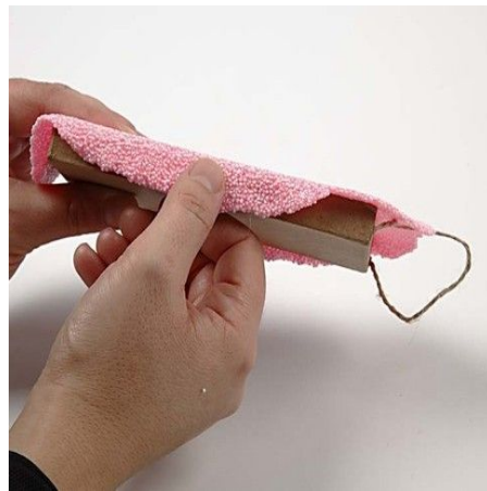
2. Place the Foam Clay sheet onto the icon.