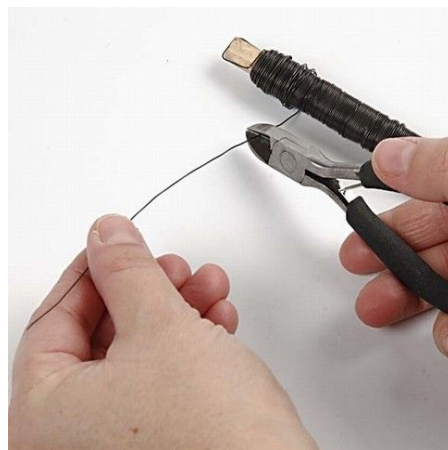
5. Cut floral wire for arms.