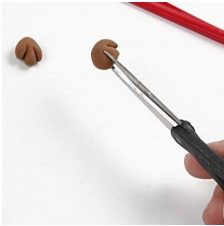
7. Roll two balls for hands and cut two notches.