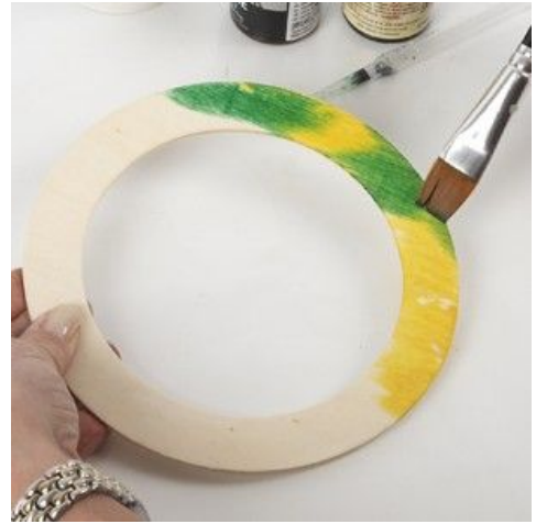
4 Je kunt de kleur uitvegen met een penseel.