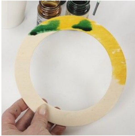
3 Druppel met een tweede kleur.