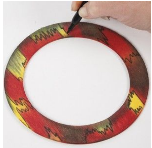
6 Decoreer met fantasievormen met een zwarte stift.