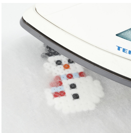
2 Strijk de figuren op de stand Katoen.