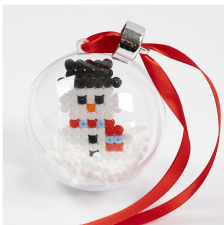
5 Sluit de bal en bevestig een lint aan de versiering.