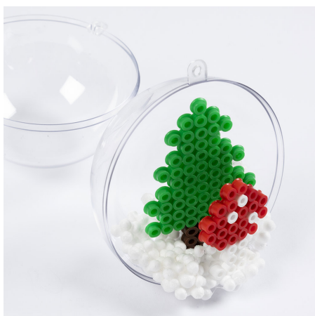
4 Zet de twee bomen willekeurig in de bal.