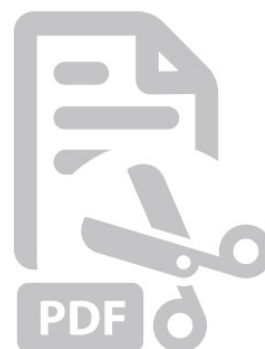
Sjabloon Print het sjabloon hier.