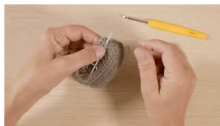
Zo hecht u uw haakwerk af Leer hoe u de uiteinden afhecht.