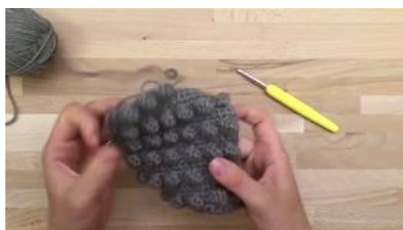
Zo haakt u popcornsteken Leer hoe u popcornsteken haakt.