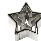
Uitstekers, grootste maat 40x40 mm, , ster, 3stuks 78785