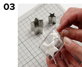
03 Druk de vormen tegen de glazen theelichthouder en laat het 24 uur drogen.