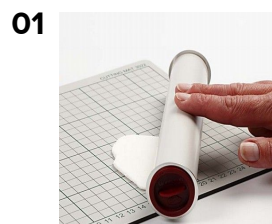
01 Rol de Silk Clay uit met een roller.