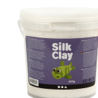
Silk Clay®, wit, 650gr 79125