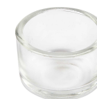
Waxinelicht, d: 5 cm, h: 3,5 cm, 8stuks 55831