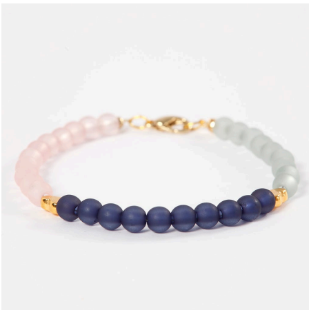
Nog een voorbeeld -

3 Sluit de armband zoals te zien is bij inspiratie 12294.