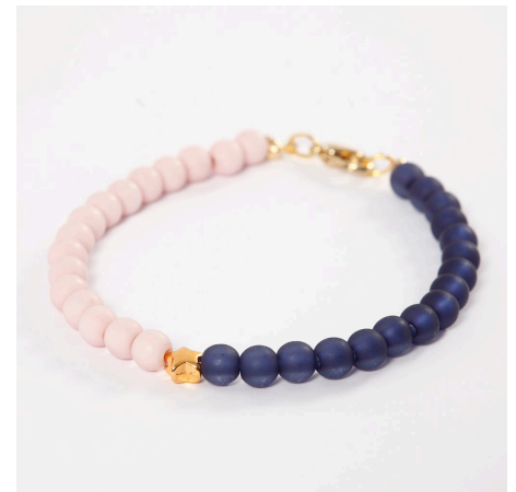
Nog een voorbeeld -