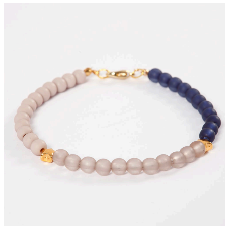
Nog een voorbeeld -